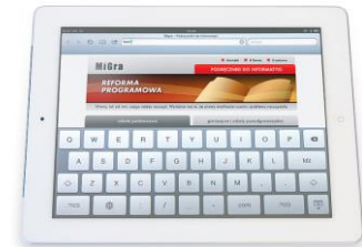
Rysunek 5. Tablet

Urządzeniem wzorowanym na laptopach jest tablet (rys. 5. 5 ). Jest to również przenośny komputer osobisty, ale bez tradycyjnej klawiatury. Ekran jest nieco mniejszy niż w laptopie i reaguje na dotyk (ekran dotykowy). Oznacza to, że funkcje programów wybiera się, dotykając ekranu specjalnym piórem, które należy do wyposażenia tabletu, lub palcem. Tablet posiada dodatkowe ułatwienia, np. funkcję rozpoznawania pisma odręcznego i klawiaturę ekranową. Praca na takiej klawiaturze polega na dotykaniu odpowiednich znaków wyświetlanych na ekranie monitora.