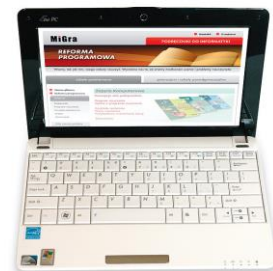
Rysunek 4. Netbook

Mniejszym od laptopa przenośnym komputerem jest netbook (rys. 4. 4 ). Jest on zazwyczaj lżejszy od tradycyjnego laptopa, a jego klawiatura i ciekłokrystaliczny ekran mają mniejsze rozmiary. Można go zatem nosić w małej, podręcznej torbie i wygodnie korzystać z niego w czasie podróży. Netbook nie ma zazwyczaj napędu optycznego potrzebnego do korzystania z płyt CD czy DVD. Posiada jednak porty USB, które umożliwiają korzystanie m.in. z urządzeń PenDrive.