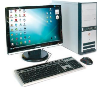
Rysunek 1. Komputer PC

Najbardziej rozpowszechnionym na świecie typem komputerów są komputery PC (rys. 1. 1 ). Szkolne pracownie komputerowe wyposażone są najczęściej w takie komputery, choć w niektórych używa się komputerów Mac (znanych wcześniej pod nazwą Macintosh), produkowanych przez firmę Apple.