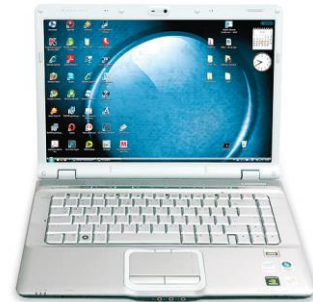
Rysunek 3. Laptop

W dolnej części znajduje się klawiatura razem z płytą główną, procesorem, pamięcią i innymi ważnymi elementami. Wbudowany jest tam również panel dotykowy (tzw. touchpad ), zastępujący mysz. W zamykaną pokrywę notebooka wbudowany jest ekran ciekłokrystaliczny, pełniący funkcję monitora.